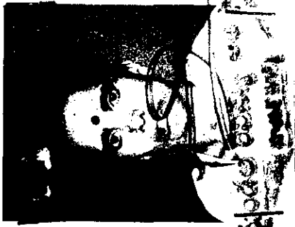
(పిసి మండల రెవిన్యూ అధికారి ప్రభుత్వ పని, ముద్ర వేయాల)