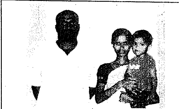
Family Members Details